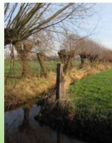
Een knotwilgenrij levert nog meer op voor de natuur (insecten en vogels) als er een combinatie is met een ruige slootkant.

Al verschillende jaren organiseren landbouwbedrijven in het Binnenveld streekmarkten samen met de ANV het Binnenveld. Tot nu toe deden de boeren dat kosteloos terwijl er wel heel veel tijd in gaat zitten. Het bestuur heeft daarom besloten om de organisatoren van ANV streekmarkten financieel te ondersteunen met 200 euro per keer voor productie van posters en flyers. Dit kan deels uit budget van streekproducten, deels uit de ANV pot. Voor de markten geldt dan de voorwaarde dat alle streekproducenten in het Binnenveld een uitnodiging krijgen om een kraam in te richten. Ook moet duidelijk zijn dat de ANV mede-initiatiefnemer is. Dat kan door het ophangen van de ANV vlag op het evenement en door vermelding in de PR als mede-initiatiefnemer. De open boerderijdag valt niet onder deze afspraak.