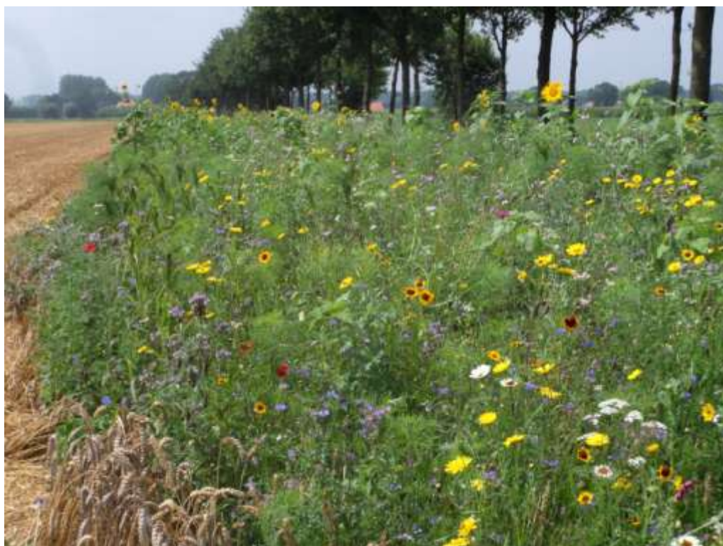
Bloemrijke akkerranden worden erg gewaardeerd door burgers

Natuurinclusieve landbouw staat op dit moment hoog op de agenda van natuur- en landbouworganisaties, maar hoe kun je daar een impuls aan geven, vooral als er geen of te weinig subsidiemogelijkheden zijn?