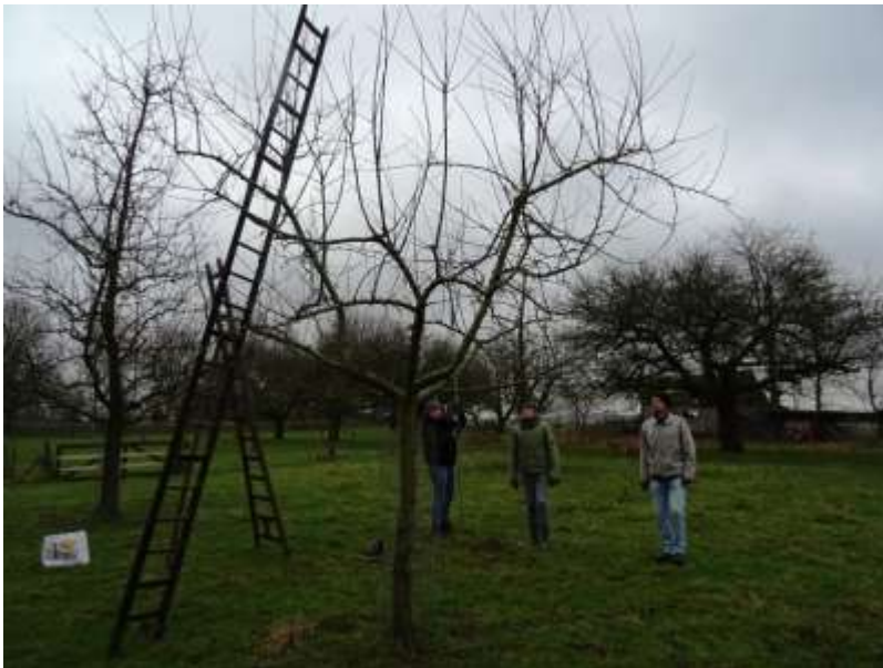
Praktijkdag snoeien hoogstamfruit in de boomgaard van de Wolfswaard

In december 2017 is in Wageningen de cursus snoeien hoogstamfruit van start gegaan voor vrijwilligers en eigenaren van hoogstamboomgaarden. In totaal hebben zich 15 mensen aangemeld. Ondertussen zijn er al 3 praktijkdagen gehouden in de oude hoogstamboomgaard bij de Wolfswaard. De bedoeling is dat de deelnemers als vrijwilliger mee kunnen gaan werken in de boomgaard van de Wolfswaard of dat zij, bewapend met de praktische kennis van de cursus aan de gang kunnen gaan met hun eigen hoogstambomen.